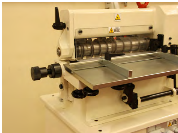
Regolatore taglio- Cutting fence