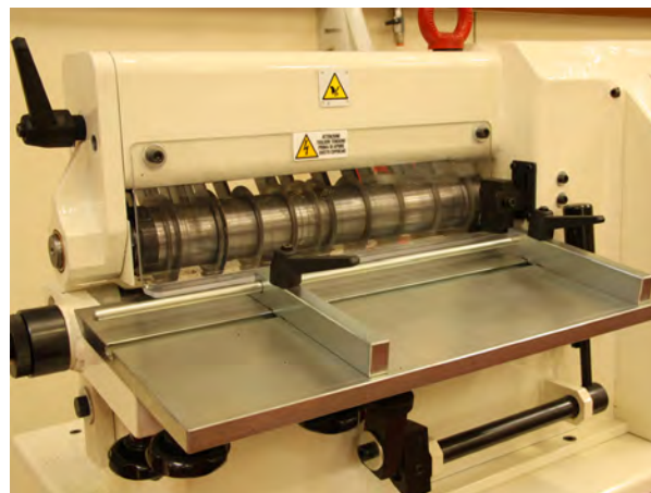
Tavolo - Worktop